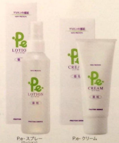
Pe- スプレー (ローション)